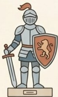
рыцарь в доспехах

Посмотри на скульптуры. Найди для каждой ее тень. Соедини пальчиком.