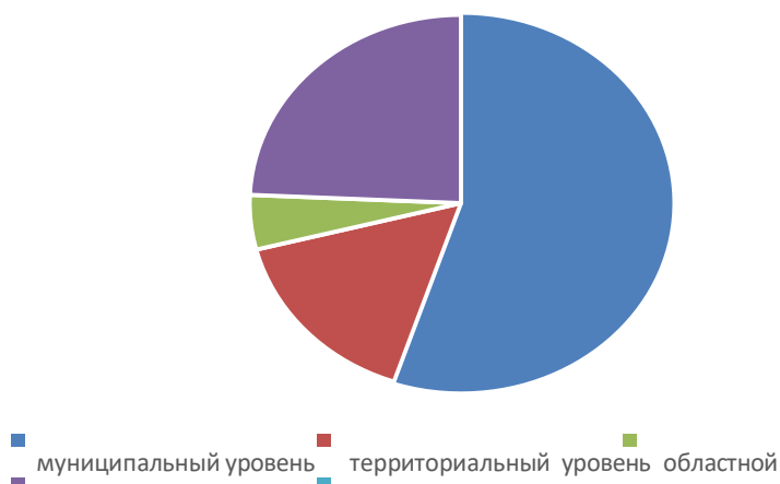
Участие педагогов в конкурсах профессионального мастерства